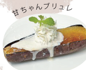
ガちゃんブリョレ