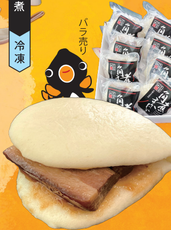
角煮まんじゅう 冷凍

令和6年 10月16日(水)~22日(火) 9:30~18:30 (初日は11:00~ 最終日は14:00まで)