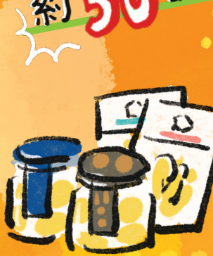
小長井牡蠣の加工品